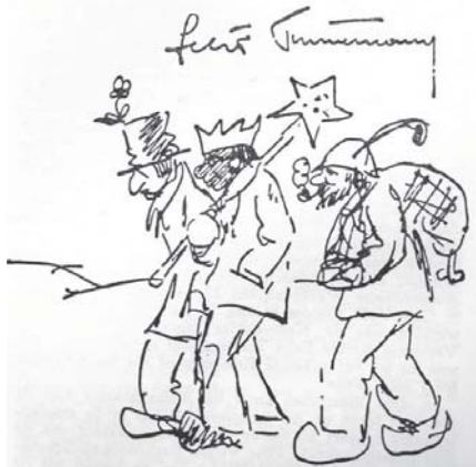
Drie volkse koningen ontleend aan Felix Timmermans

Voor de gelegenheid wordt het Vossenhol, de oefenruimte van volkskunstgroep Reintje Vos, omgebouwd tot een heus poppentheater. We kruipen dicht bij elkaar om te genieten van wat poppen ons te vertellen hebben. Meer dan 40 leden van de groep werken actief mee. Het orkest vertolkt kerst- en driekoningenliederen, waarbij kan meegezongen worden. IVV geeft mee advies voor muzikale intermezzo's en (volks) danspassages.