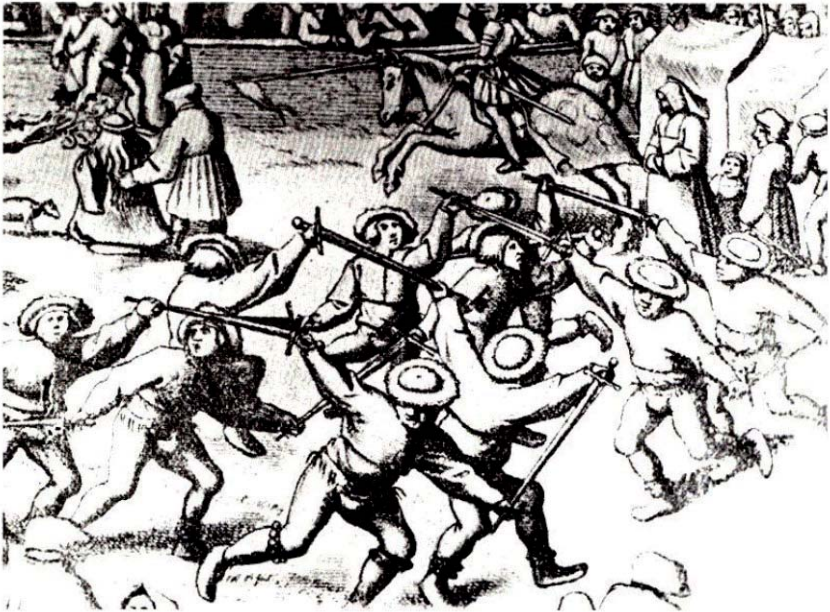
Zwaarddans: detail uit Breugel's schilderij.

Er bestaat een monumentale zwaarddanstraditie in Vlaanderen. De oudste vermelding dateert van 1389 in Brugge (1) . Tal van rekeningen voor optredens van zwaarddansen bleven bewaard in de archieven. De bundel 'Dansen uit Hoogstraten' bevat een uitgebreide bijdrage over zwaarddansen en kalverdansen te Hoogstraten. Het Vlaams Dansarchief beschreef verschillende zwaarddansen in zijn bundel 'Mannendansen' (2) . Sommige volkskunstgroepen zoals Lange Wapper leggen zich toe op het uitvoeren van zwaarddansen. De meest indrukwekkende uitvoering betreft een weer tot leven brengen van een zwaarddans, op basis van wat Breugel schilderde (3) . We mochten de dansers van Lange Wapper verwelkomen ter gelegenheid van de reeds eerder genoemde vaartfeesten in Stekene. Ieder jaar is de dans te zien op de zondag van halfvasten aan de Antwerpse Onze-Lieve-Vrouw Kathedraal. Zwaarddansen vormen een mooi voorbeeld van impressies uit het verleden, weer tot leven gebracht via creatieve ingrepen.