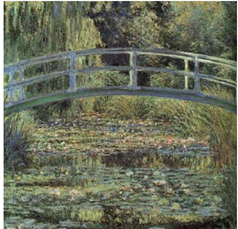
Figuur 1: de Japanse brug en de waterlelies van Claude Monet (1899, National Gallery, London).

Het impressionisme ontstond in Frankrijk als een kunststroming, onder andere in de schilderkunst. Kunstenaars revolteerden in de tweede helft van de negentiende eeuw tegen een volgens hen te klassieke en academische benadering van de toenmalige kunst. Schilders gingen aan de slag met lichteffecten en kleuren. Ze legden hun beelden vast in de omgeving die ze wensten weer te geven. Het leverde prachtige resultaten waarvoor menige impressionisme-fan de wereld afreist. De waterlelies van Monet spreken nog steeds tot de verbeelding.