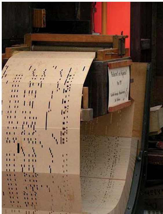
Figuur 3: orgelboek van een Decap orgel in een boekenwiel 5

De techniek bleef ook niet stilstaan. Ventilatoren vervingen gaandeweg de blaasbalgen. Het boekenwiel deed zijn intrede: hierin werden een aantal boeken aan elkaar geplakt, zo moest er niet continu een boekenlegger achter het orgel plaatsnemen.