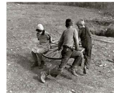
Figuur 1: kinderen maken zelf hun primitieve carrousel.

Bronnen vermelden een afbeelding van ruiters in manden, opgehangen aan balken bevestigd aan een centrale paal. Dat toestel wordt beschouwd als de verre voorloper van de carrousel, zo'n 1500 jaar geleden. Kruisvaarders maakten kennis met een roterende constructie waarmee ruiters zich oefenden in bewegend vechten. Het woord carrousel is afgeleid van het Italiaanse garosello en het Spaanse carosella wat zoveel betekent als 'klein gevecht'. Maar dat was niet de enige betekenis. Rond de carrousel werden ook palen met opgehangen ringen opgesteld. De ronddraaiende ruiters moesten met hun lansen door de ringen priemen. Hierin herkennen we duidelijk de voorloper van het nu nog steeds beoefende 'ringsteken'. Paarden of muilezels trokken de constructie; uitzonderlijk gebeurde het voortstuwen met mankracht. Het paardendefilé bij koninklijke huwelijken werd ook 'carrousel' genoemd. Kortom: het begrip carrousel had van bij het begin te maken met draaiende bewegingen, ruiters en paarden.