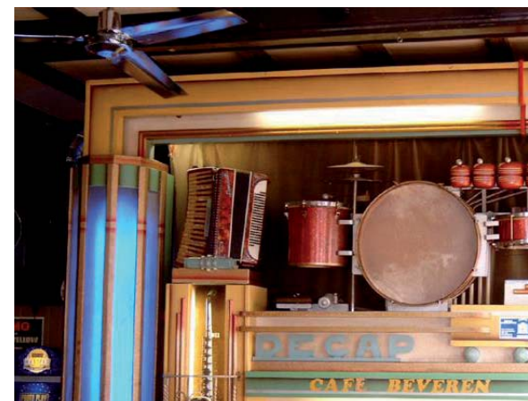
Figuur 2: een DeCap orgel in cafe Beveren (Antwerpen). Voor een lijst van plaatsen waar dergelijke orgels kunnen beluisterd worden verwijzen we naar de voetnoot. 4

carroussel, want muziek bepaalde mee de sfeer in en rond de attractie. Orgelbouwers vinden we vooral in Duitsland, Frankrijk en België. Al snel vormden de bandorgels een onlosmakelijke eenheid met paardenmolens. Na de grote recessie ging de orgelbouw door, ook in de Verenigde Staten, met Wurlitzer als bekendste (bij deze naam denken we ook aan de befaamde 'juke box') 2 . Maar ook aan die succesperiode komt een einde. Eigenaars van carroussels werden het kostelijke onderhoud van de orgels beu. Bovendien waren deze orgels moeilijk te transporteren van kermis naar kermis. Opkomst van geregistreerde muziek leidde tot meer gebruiksvriendelijke geluidsinstallaties. Dat was nochtans buiten de smaak van het publiek gerekend. De deuntjes en de typische klank van de bandorgels oefenden een bijzondere aantrekkingskracht uit op de abonnees van paardenmolens, zo bleek. Een carroussel zonder bandorgel werd aanzien als een lichaam zonder ziel. De bandorgels stegen terug in kwalitatieve en kwantitatieve waarde. De hernieuwde belangstelling is een hart onder de riem voor orgelbouwers. Ook Vlaanderen liet en laat zich niet onbetuigd. In Antwerpen vinden we orgelbouwer Decap 3 . Aloïs Decap en zijn zoon Livien begonnen in 1902 draaiorgels te bouwen. Hun bedrijf groeide uit tot het grootste van België. Steeds meer instrumenten deden hun intrede in de constructie, zoals het accordeon (1933), het drumstel (1935) en de saxofoon (1936).