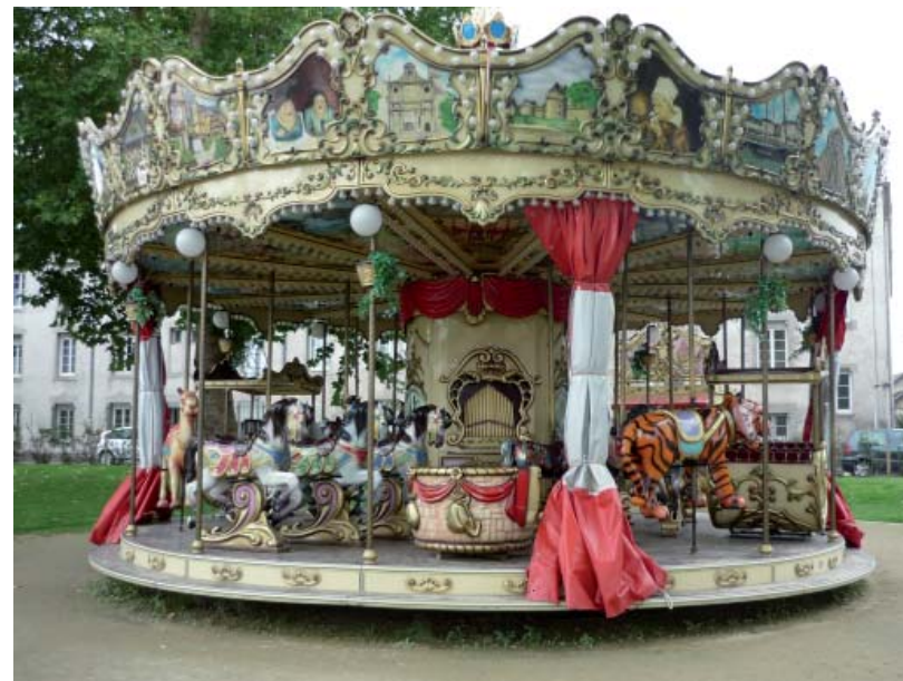
Figuur 4: carrouzels zijn ware attracties voor jong en minder jong.

Het hoeft ons niet te verwonderen dat de carrousel in bovengenoemd gegeven een bijzondere plaats innam, naast fotografie en windbuksen. De na 1860 door stoommachines aangedreven paardenmolens moeten op het publiek een bijzondere indruk nagelaten hebben. In het begin van de 20ste eeuw waren de befaamde stoomcarrouzels zoals deze van Vandersypen, de Grand Carroussel à Chevaux Galoppant & Gondoles van Leener-Opitz, de Grand Carroussel-Salon Fermé Hollandais en de American Cake-Walke van Schenoff-Xhaflaire graag geziene attracties tijdens Gentse jaarmarkten.