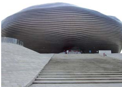
Kunsthistorisch Museum Ordos