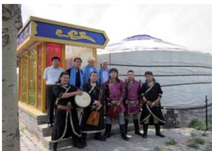
Typisch Mongools muziek ensemble.