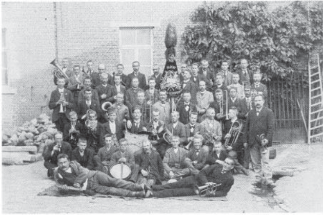
De Sint-Cedilafanfare van Haacht omstreeks 1900.

vernieuwde koperinstrumenten, die goedkoper waren, en dat betekende gouden jaren voor de fanfares. In de steden had men in heel wat muziekverenigingen zowel een harmonie als een koor. De fanfare was typisch voor het platteland. Elke muziekvereniging had werkende en ereleden. De vaandeldrager en de speler met de grote trom 'grosse caisse' stapten aan het hoofd van de muziekvereniging. Vaandeldrager en grosse caissedrager werden financieel vergoed. De repetities waren een hoogtepunt voor de muzikanten in de wekelijkse sleur. In 1980 leverde Vlaanderen in België 80 % van de muziekverenigingen.