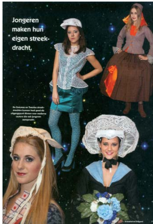
Hedendaagse ontwerpen uitgaande van traditionele klederdrachten

en Immaterieel Erfgoed organiseerde in november jl. een studiedag over het thema. Hierbij ontwierpen jongeren moderne versies uitgaande van Zeeuwse en Twentse streekdrachten (zie figuur).