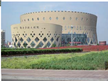
Cultureel Centrum Ordos