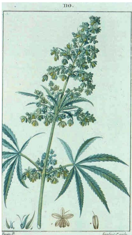
Figuur 1: bloeiende toppen van een vrouwelijk exemplaar van Cannabis sativa L. waarvan de bovengrondse delen gebruikt worden als recreatieve 'drug'. Cannabis was oorspronkelijk een medicinale plant. Gebruik voor geneeskrachtige doeleinden stoelt op een traditie van meer dan 10.000 jaar, te oordelen naar afbeeldingen op Chinees aardewerk (1) .

Ondertussen is de 'moeder van alle verkiezingen' achter de rug. De polls in acht genomen had de jongste verkiezingsronde eigenlijk niet gehoeft. Maar de burger moet minstens de gelegenheid krijgen om zijn rechten te gebruiken. Tal van partijcongressen gingen de verkiezingen vooraf. Een van de opvallendste uitspraken kwam van onze minister-president Kris Peeters: ' Alleen onze partij doet mensen geen pijn ' (3) . Deze uitspraak moeten we met een grove korrel zeezout nemen, zeker wanneer we op wandel gaan in de culturele sector.