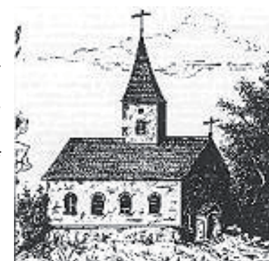
De eerste stenen kapel

Waarschijnlijk zijn de eerste bedevaarders wel van Zichem geweest. Maar dat heeft zich dan toch uitgebreid, zodat er op het laatste van Diest en van Bekkevoort – dat allemaal bestond, want Zichem is een oude stad van in 1300, geloof ik – mensen naar hier op bedevaart zijn gekomen en dan hebben ze daar het eerste kapelletje in hout gezet. Dat is dan te klein geworden, en dan hebben ze daar een stenen kapelletje gezet. Volgens het schijnt, zou dat de kapel zijn van de Allerheiligenberg in Diest. Ze zouden die afgebroken hebben en daar teruggezet hebben. Dat heb ik pas nu vernomen. Of het de waarheid is, dat weet ik niet. Dat was dus een stenen kapel, die was ook veel te klein.